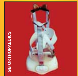
Nẹp Milwaukee (CTLSO)