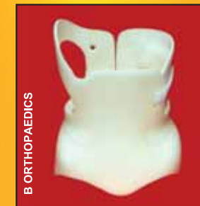
Nẹp dưới nách (TLSO)

Thông thường người ta cho đeo nẹp khi xương cong hơn 25 độ. Nẹp đặt làm cho riêng từng người, và thường có miếng lót bên trong của thanh để kiểm soát tối đa độ cong. Dưới đây là hình hai loại nẹp. Nẹp dưới nách còn gọi là TLSO thường dùng để kiểm soát lưng cong phía dưới. Nẹp Milwaukee hay CTLSO dùng để kiểm soát lưng cong phía trên và cho trẻ rất nhỏ còn lớn thêm trong các năm tới. Một nẹp khác dành cho bệnh nhân mà lưng chỉ cong một khúc ở phần hông. Chuyên gia sẽ đề nghị loại nẹp tốt nhất cho bệnh nhân.